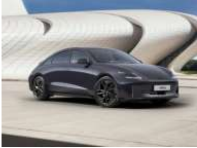
Hyundai IONIQ 6

2023 : L'Administration Biden lance le plan de subventions « IRA » qui vise à développer l'automobile électrique américaine. La Chine devient le premier marché et le premier exportateur de véhicules électrique au monde. L'Europe étudie la protection de son industrie automobile, sa « réindustrialisation », et les « giga-factories » de batteries sont lancées dans plusieurs pays dont la France (Hauts-de-France). La recherche de Lithium, essentiel aux batteries, devient un enjeu d'indépendance nationale.