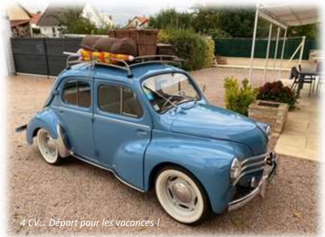
4 CV... Départ pour les vacances !

1967 : Lancement de la Toyota Corolla au Japon qui deviendra, dans toutes ses versions, la voiture la plus vendue