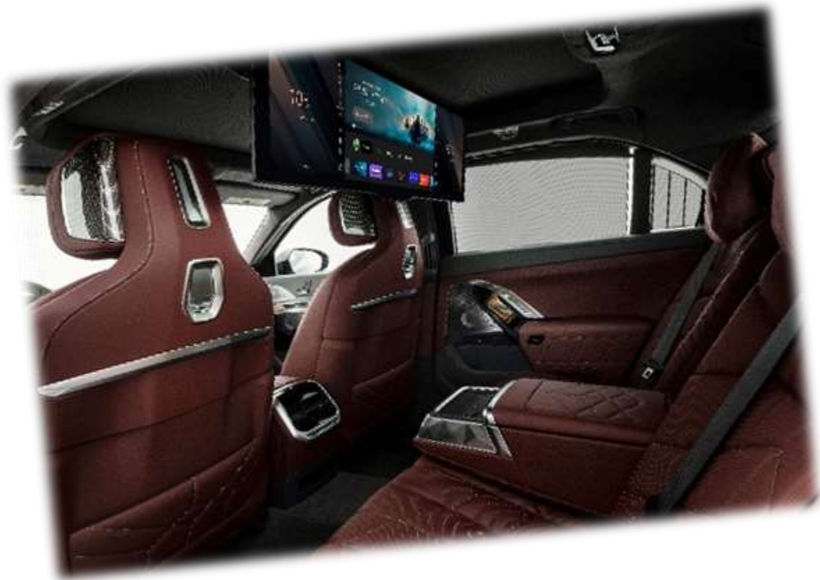
Les équipements derniers cris de la BMW série 7 Sedan