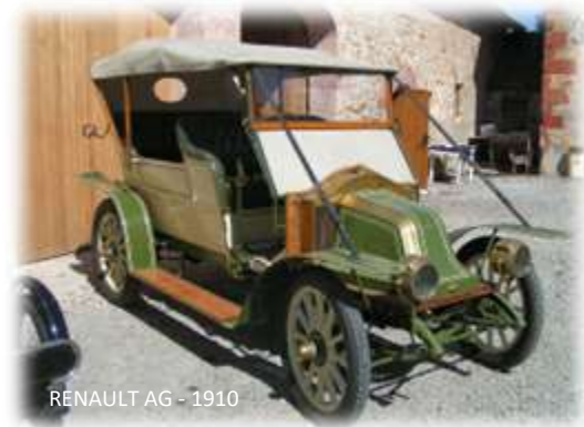
RENAULT AG - 1910

La France réalise une prouesse de logistique avec les camions pour Verdun sur la Voie Sacrée (Berliet). Le char d'assaut moderne, le Renault FT est inventé.