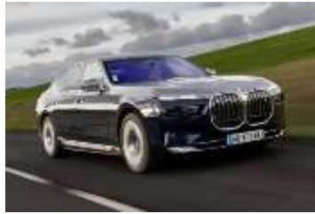
BMW série 7 Sedan