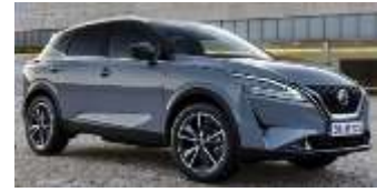
QASHQAI E6 POWER