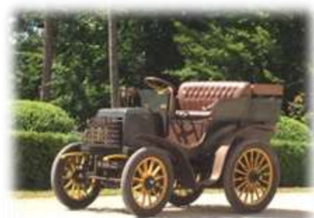
PANHARD M2F 1897

Gottlieb Daimler et Wilhelm Maybach mettent au point leur prototype Daimler Stahlradwagen, première automobile à quatre roues avec moteur à essence (deux cylindres en V), qu'ils présentent sur le stand Panhard & Levassor de la galerie des « machines et des progrès techniques » de l'Exposition universelle de Paris de 1889.