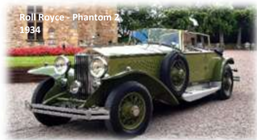
Roll Royce - Phantom 2 1934

1934 : Henri Théodore Pigozzi crée une firme automobile Franco-Italienne pour produire en France des véhicules