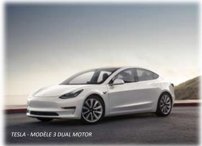
TESLA - MODÈLE 3 DUAL MOTOR

Dunlop investit 16,5 millions d'euros dans l'usine de Montluçon pour moderniser la production.